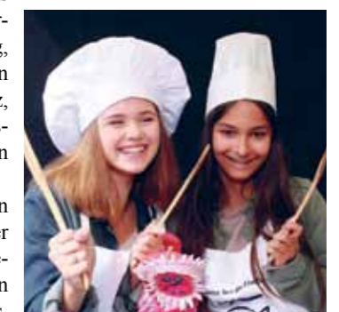
Erinnerungsfotos nach Art der Stadtwerke Barmstedt.

Das soll bei der GEWA mit einem passenden Erinnerungsfoto vermittelt werden. In der „Fotobox“, die in einem Klassenzimmer ein paar Schritte vom Stand entfernt steht, können in Ruhe Erinnerungsfotos geschossen werden. Die passenden Küchenutensilien für die Käsekuchen-Vorfreude kommen natürlich mit auf das Erinnerungsfoto. Das gute Gefühl, in der Küche Öko-Strom zu nutzen, funktioniert übrigens nicht nur mit Käsekuchen.