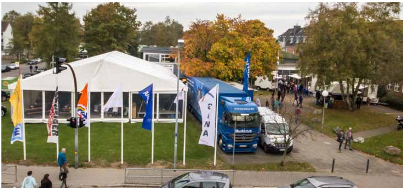
Auch 2018 finden interessante Aussteller den Weg zur GEWA nach Wahlstedt und freuen sich auf die Besucher.

Die Gewerbe- und Industrieschau Wahlstedt, kurz GEWA, geht in ihre 29. Runde. Auch 43 Jahre seit ihrer ersten Auflage hat sie wohl nichts von ihrer Attraktivität verloren. Das beweist die große Zahl an Ausstellern, viele davon halten dem Wahlstedter Publikum seit vielen Jahren die Treue. Sie alle haben sich in diesem Jahr wieder etwas Besonderes einfallen lassen. Vom 5. bis zum 7. Oktober ist es endlich wieder so weit. Dann wird aus der Poul-Due-Jensen-Schule in Wahlstedt und ihrem Aussengelände wieder der beliebte Markt. Der hat sich längst etabliert und wird wohl wieder zum Publi-