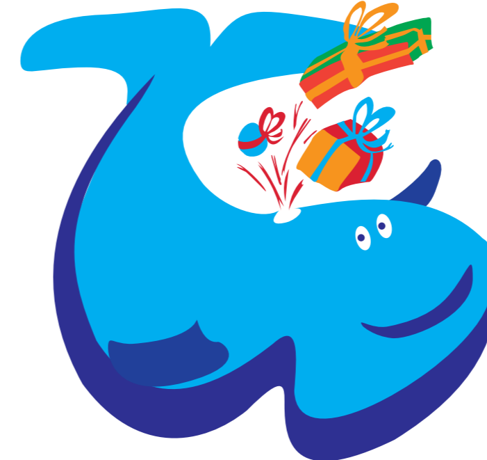
Der Wahli ist die „Geschenkwährung“ für Wahlstedt. Einige davon sind in der Tombola zu finden. Grafik: Gewerbeverein Wahlstedt

Stand: September 2018 - Bitte vergleichen Sie unter www.wahli-gutschein.de