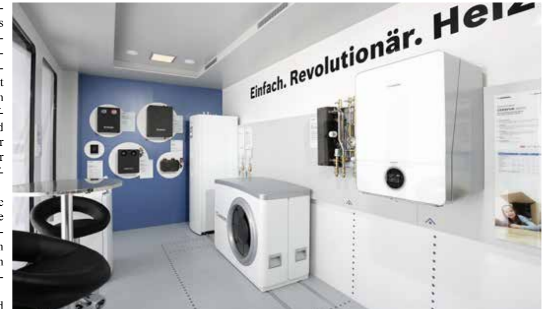
Moderne Heiztechnik zum Anfassen im Info-Truck von Junkers.