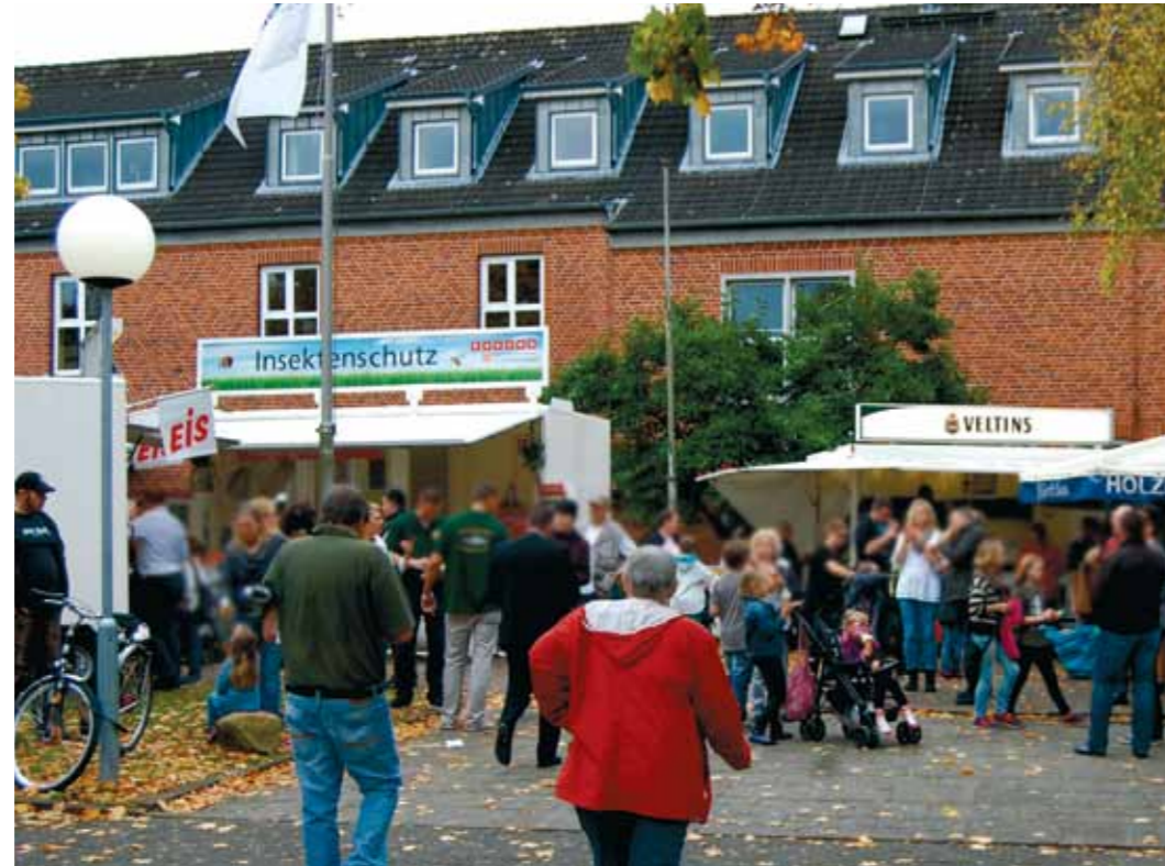
Seit 1975 führen die Wege der Wahlstedter und vieler Besucher in die Poul-Due-Jensen-Schule.

Das erste Jubiläum beging die GEWA 1979 mit der fünften Auflage. Dabei wurde zusätzlich ein Ball mit Modenschau veranstaltet. Als Moderation dieser Veranstaltung konnte damals Fernsehansagerin