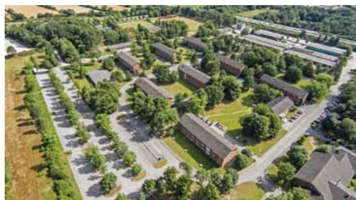
Gute Lage, flexibles Raumangebot: Der Levo-Park.

Levo-Teams. Mit zu den Dienstleistungen gehören ein leistungsfähiger Hausmeisterservice sowie ein Gärtner, die für reibungslose Abläufe und angenehmes Arbeitsklima sorgen. Außerdem gibt es auf dem Gelände Gastronomie und auch eine Automaten-Tankstelle. Dazu stehen im LevoPark Seminar- und Vortragsräume zur Verfügung. Mit seiner Lage direkt an der Autobahnausfahrt „Bad Segeberg Nord“ an der A21 bietet der LevoPark eine optimale Verkehrsanbindung. Besuchern, Kunden und Mitarbeitern können ausreichend Parkplätze zur Verfügung gestellt werden. (uz)