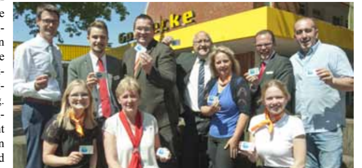
Wahli-Geschenkgutscheine gibt es bei der Sparkasse, der VR-Bank und der Raiffeisenbank.

auf den Markt kommen. Eingelöst werden kann der Gutschein dann bei den teilnehmenden Mitgliedsbetrieben des Gewerbevereins. Eingelöst sollten werden die Gutscheine dann jeweils für den vollen Nennwert. (uz)